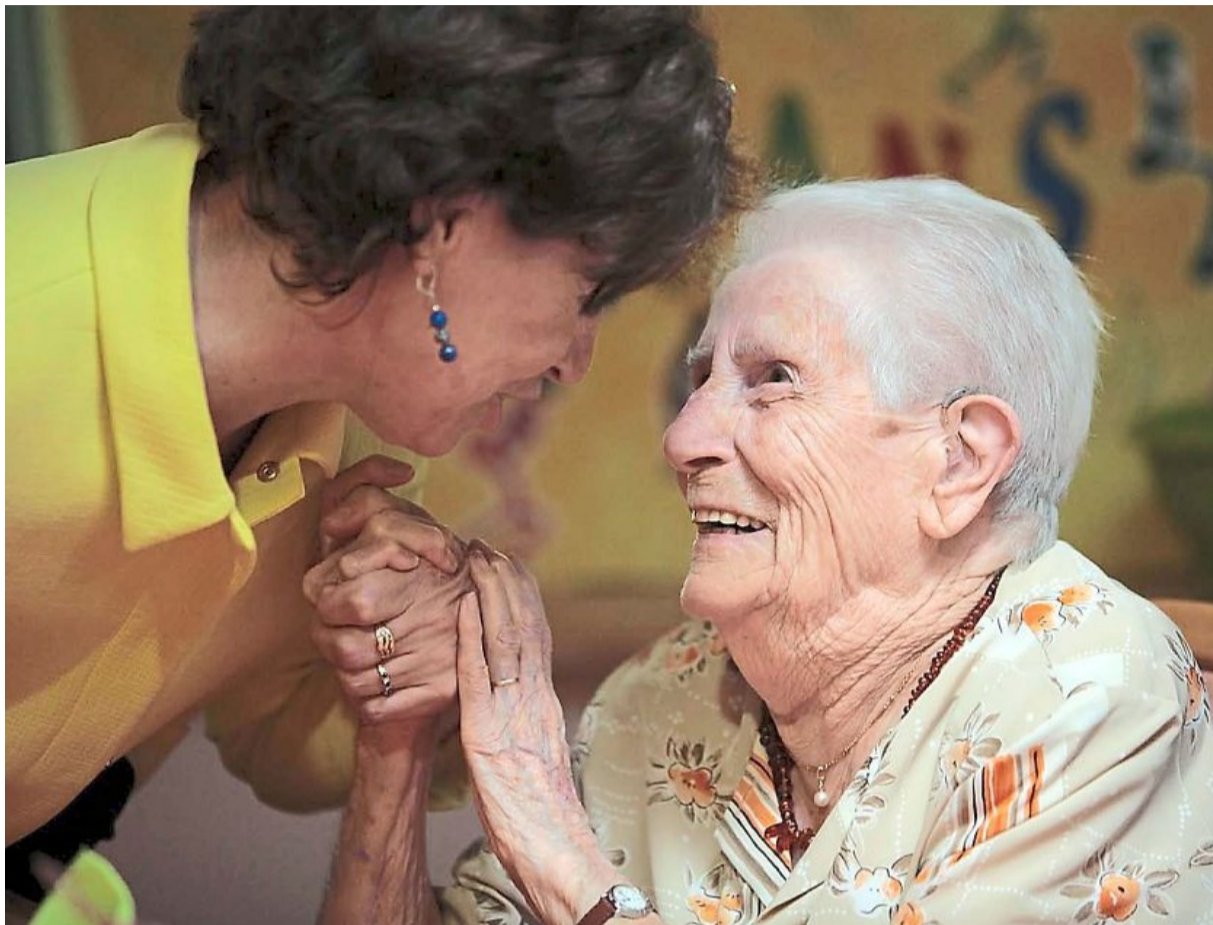
Avant l'intervention des professionnels de santé et des travailleurs sociaux, le rôle des familles est primordial dans la prise en charge des personnes âgées dépendantes.

Le pharmacien a repéré la première fois que M me P., 76 ans, semblait désorientée. Le cabinet infirmier de Trélazé a été sollicité pour préparer son pilulier et ses doses d'insuline. « Nous nous sommes aperçus qu'elle prenait un cocktail impressionnant d'anxiolytiques », confie Benoît Bender, infirmier libéral. Autour d'elle, M me P. n'a qu'un fils et deux filles éloignés, et Monsieur G., un vieil amant rencontré en bord de mer, qui a aussi fréquenté sa sœur. « M me P. sort parfois en chemise de nuit. Elle a déjà acheté un matelas à 3 000 € à un marchand ambulancier. Elle oublie parfois des choses sur le feu. Il y a déjà eu un début d'incendie chez elle. Elle ne s'alimente presque plus », raconte l'infirmier. Il a proposé une aide à domicile quotidienne, mais les enfants ont trouvé cela trop coûteux. Devant la disparition régulière de chèques et les risques d'incendie, les enfants se sont résolus à trouver une place pour leur mère en foyer-logement. « Aujourd'hui, elle est heureuse où elle est ».